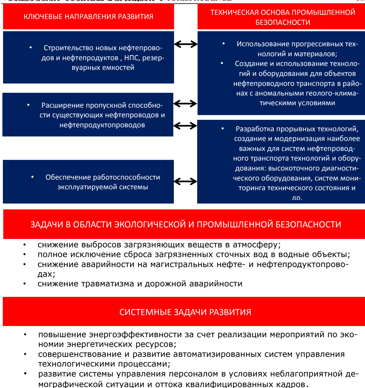
Рис. 2 Взаимосвязь системы управления безопасностью со стратегическими задачами развития.

Методическое обеспечение системы управления промышленной безопасностью