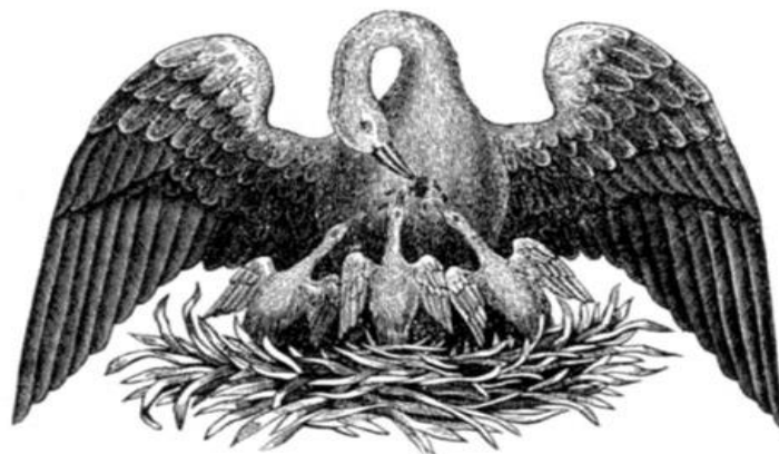
Рисунок 2. Герб учреждений, находящихся под эгидой Марии Федоровны.

Заботу о сиротах проявляла, и жена Павла I- Мария Федоровна. Именно ею было положено начало системе воспитания сирот в семьях. Современники называли ее «министром благотворительности», так как она всецело посвящала себя благотворительным делам и проектам, основное направление которых было призрение и обучение сирот. К 1909 году в системе Ведомства учреждений Марии Федоровны было 1192 заведения [7]. Многие учреждения, построенные под ее руководством, успешно функционировали вплоть до революции 1917 года, когда все благотворительные учреждения закрываются.