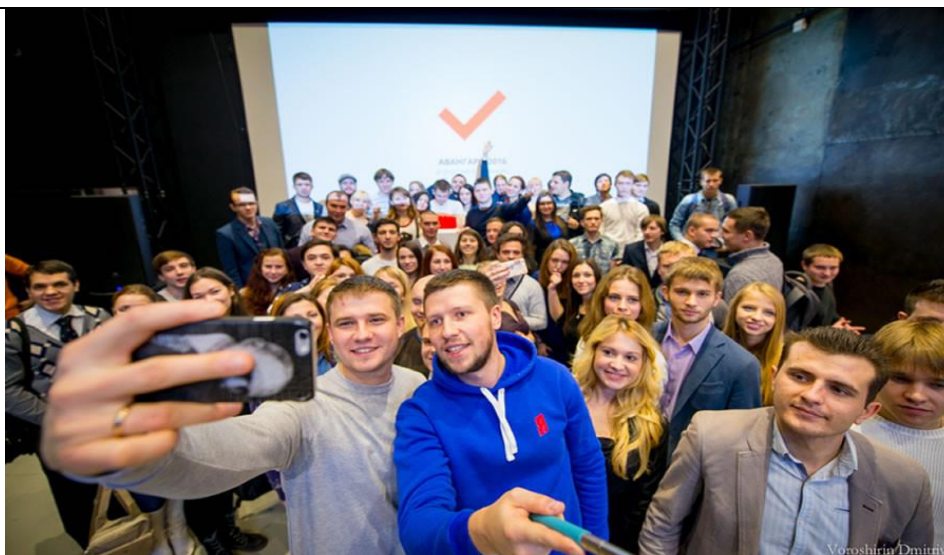
Рис.1. Молодые избиратели.

Второй метод – осознание значимости своего участия в управлении делами государства через системную и активную молодежную политику. В стране наблюдается постепенный переход от системы реализации политики для молодежи к политике вместе с молодежью [4]. Появляются качественно новые объединения, действующие при органах государственной власти: молодежный парламент, молодежное правительство, совет молодых ученых и др.