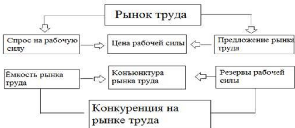
Рисунок 1. Рынок труда.

Основываясь на выше сказанном, в современных условиях актуальность государственного регулирования рынка труда увеличивается, поскольку не инициирует практически никаких колебаний в этом направлении. В связи с этим, для поступательного социально-экономического формирования России, и ее регионов, исполнительным органам власти, в свое время на местах, надлежит проводить активную политику в данной сфере для обеспечения населения рабочими местами и сокращения роста безработицы.