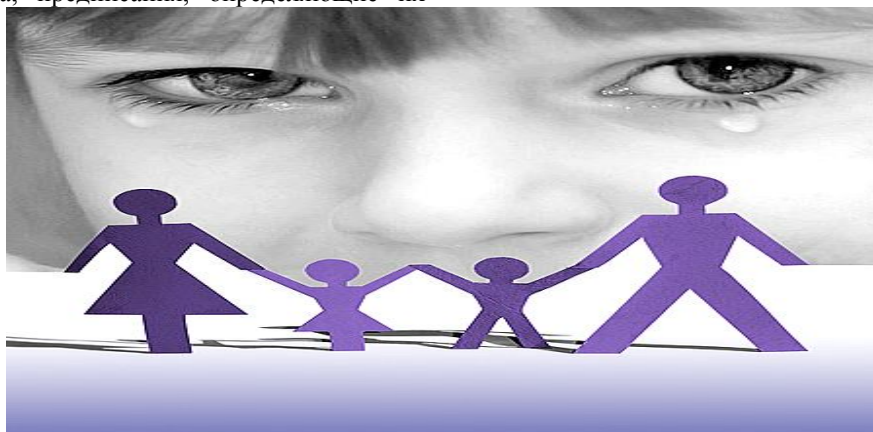
Рис. 1. Детские слезы.

Социальные сироты – это особая социально-демографическая группа детей, которые формально имеют родителей, но в силу социальных, экономических, морально-психологических и физических причин фактически лишены родительской опеки. К социальным сиротам относятся и безнадзорные и беспризорные дети, то есть “дети улицы” [1]. Это дети, лишенные экономических, культурных и социальных ресурсов, не защищенные семьей и обществом. Дети считаются сиротами в связи с уклонением родителей от их воспитания или от защиты их прав и интересов, отказом родителей взять своих детей из воспитательных, лечебных учреждений, учреждений социальной защиты населения и других аналогичных учреждений и в иных случаях – с признанием ребенка таким, который остался без родительской опеки в установленном законом порядке.