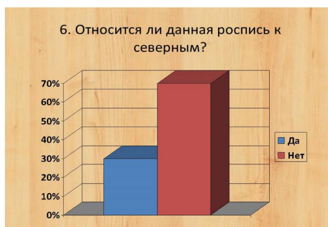
Рисунок 7 Ответы на шестой вопрос анкеты

И последний вопрос был о значении необходимости сохранять художественные традиции северных росписей по дереву. 60 % выбрали ответ: «Для сохранения и передачи следующим поколениям национальных особенностей нашей Родины». «Для