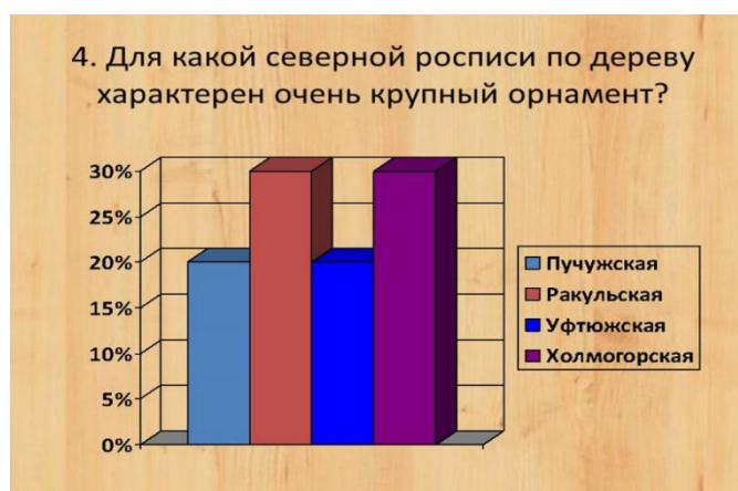
Рисунок 4 Ответы на четвёртый вопрос анкеты

Следующий вопрос был: «Для какой северной росписи по дереву характерен очень крупный орнамент?». Лишь 30 % опрошенных ответили верно, выбрав ракульскую роспись, и столько же ответили не верно, выбрав несуществующую роспись (рисунок 4).