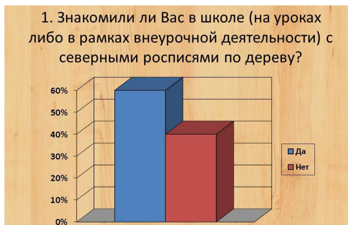
Рисунок 1 Ответы на первый вопрос анкеты

Первый вопрос был следующий: Знакомили ли Вас в школе (на уроках либо в рамках внеурочной деятельности) с северными росписями по дереву? Ответ «да» выбрали 6 человек, ответ «нет», соответственно 4 (рисунок).