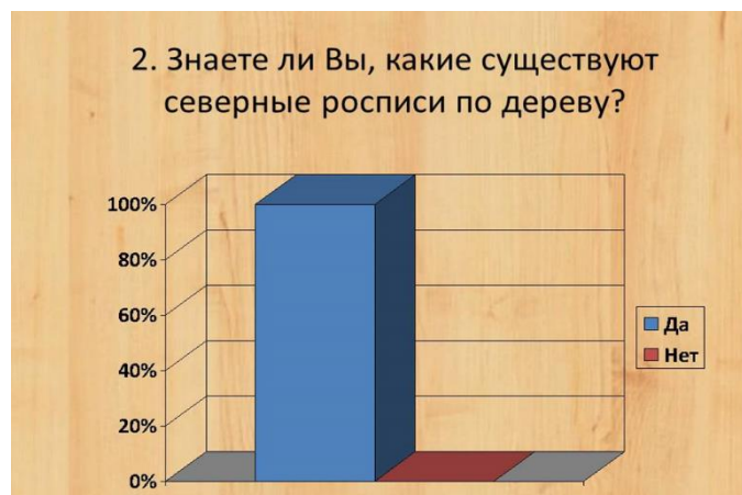
Рисунок 2 Ответы на второй вопрос анкеты

Однако на второй вопрос о том, знают ли они, какие существуют северные росписи по дереву, 100 % опрошенных ответили «да» (рисунок 2).