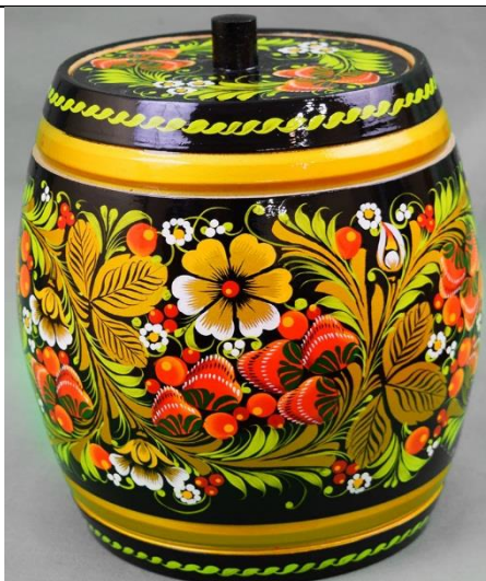
Рисунок 6 Изображение к вопросу № 6