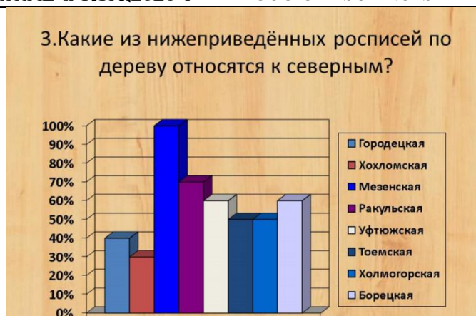
Рисунок 3 Ответы на третий вопрос анкеты

Следующий вопрос был: «Для какой северной росписи по дереву характерен очень крупный орнамент?». Лишь 30 % опрошенных ответили верно, выбрав ракульскую роспись, и столько же ответили не верно, выбрав несуществующую роспись (рисунок 4).