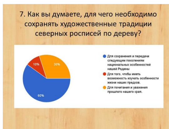
Рисунок 8 Ответы на седьмой вопрос анкеты

почитания и уважения прошлого нашего края» выбрали 30%. И 10 % ответили, что необходимо сохранять для того, чтобы иметь возможность изучать особенности жизни наших предков. Стоит отметить, что свой вариант не предложил никто (рисунок 8).