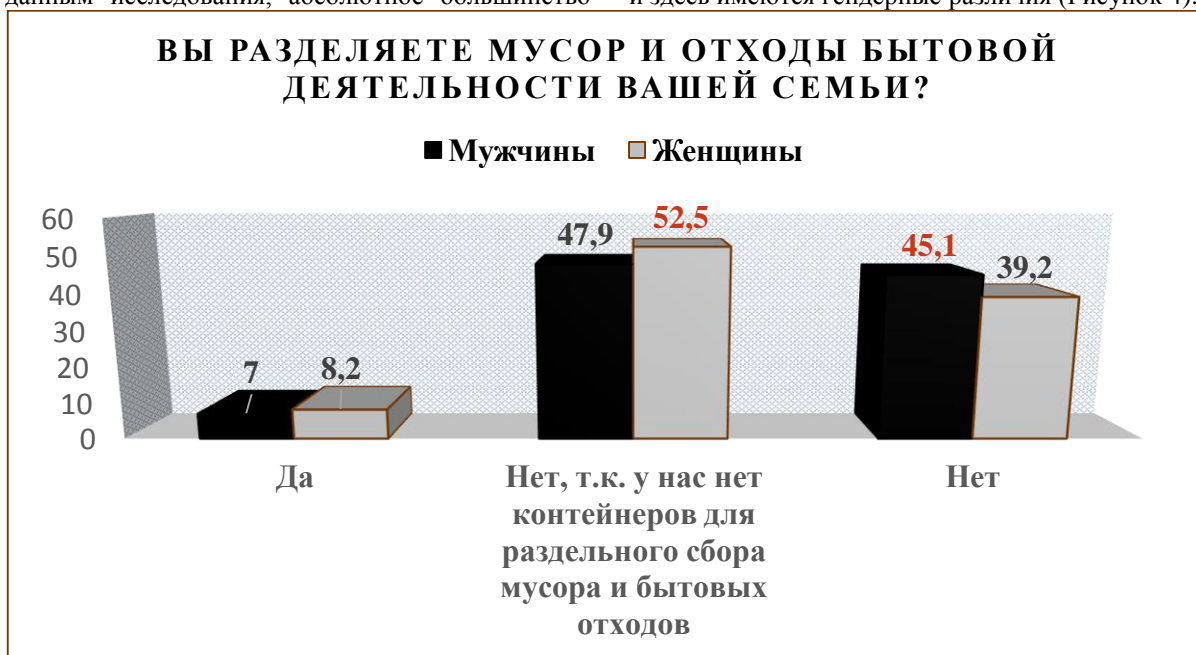
Рисунок 4. Факторы, сдерживающие формирование экологически ответственного повседневного поведения

респондентов (92,4%) не разделяют мусор и отходы бытовой жизнедеятельности их семей для дальнейшей переработки, причем половина опрошенных (50,6%) не делают этого именно из-за отсутствия контейнеров для раздельного сбора мусора. Однако и здесь имеются гендерные различия (Рисунок 4).