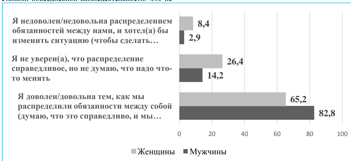
Рисунок 2. Удовлетворенность мужчин и женщин распределением обязанностей по ведению домашнего хозяйства, уходу за детьми и выполнению домашней работы

В то же время данные исследования свидетельствуют о том, что большинство опрошенных, как среди мужчин, так и среди женщин, воспринимают эти рудименты традиционалистского гендерного порядка, как устоявшуюся норму, о чем свидетельствует удовлетворенность большинства и мужчин, и женщин, сложившимся гендерным порядком (Рисунок 2).