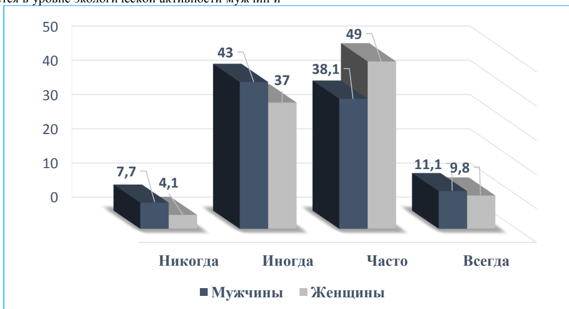
Рисунок 3. Экологическая активность мужчин и женщин

женщин, зафиксированной в ответах на вопрос: как часто вы проявляете заботу о природе? Половина опрошенных женщин (49,0%) часто заботятся о природе, тогда как среди мужчин почти столько же (43,0%) проявляют такую заботу лишь иногда, а каждый тринадцатый из опрошенных никогда этого не делает в то время, как среди женщин равнодушных к природе всего 4,1% (Рисунок 3).